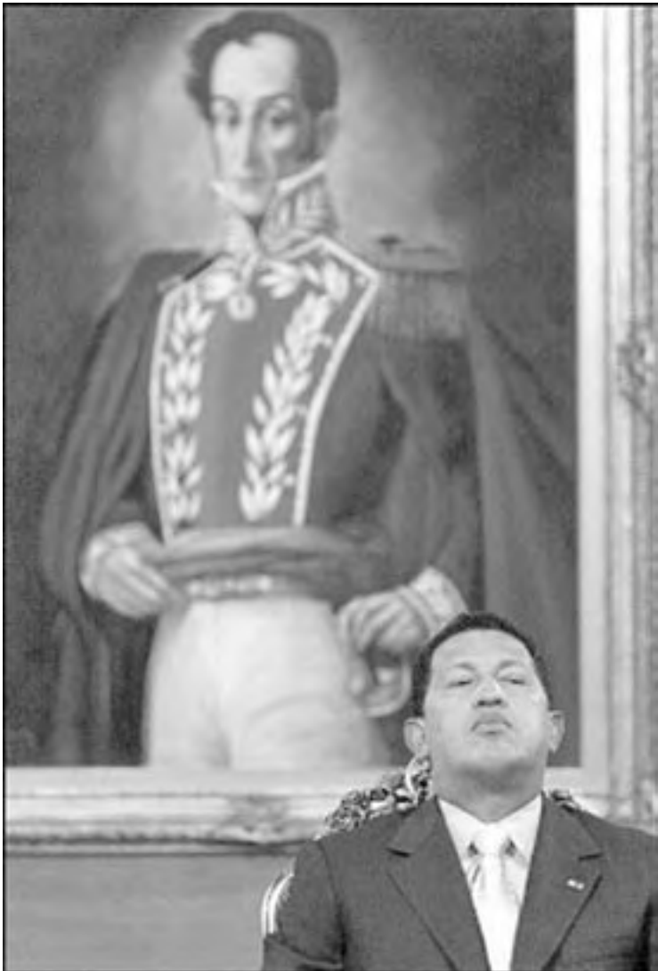
(ARCHIVO) El presidente de Venezuela Hugo Chávez durante conferencia de prensa en Caracas el 18 de setiembre de 2002. El gobierno de Hugo Chávez inmerso en un incidente diplomático con México anunció la ocupación de 700.000 hectáreas en el marco de la "guerra contra el latifundio".

CARACAS (AP) - El gobierno de Venezuela planea estatizar 1,5 millones de hectáreas de tierra "ociosa" durante el próximo año en el marco de su proyecto de reforma agraria que busca beneficiar a cooperativas de granjeros pobres, informaron el jueves las autoridades. La reforma liderada por el